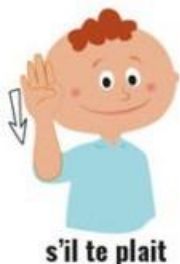
s'il te plaît